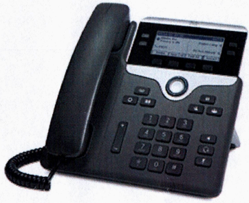
Cisco IP Phone 7821, 7841 และ 7861